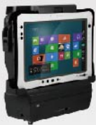
車両ドック ドストラップ